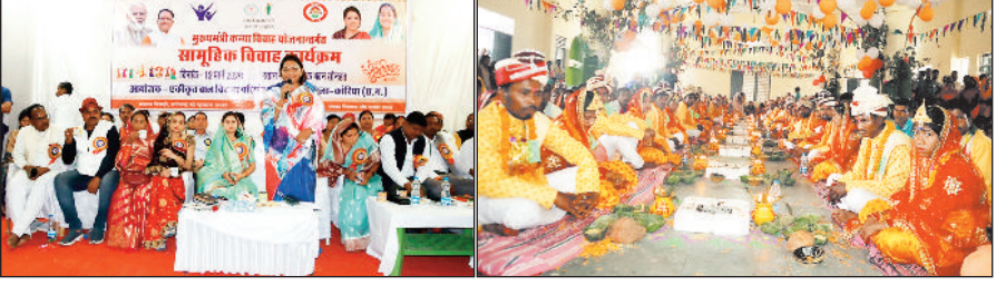
कार्यक्रम में उपस्थित विधायक व अन्य। परिणय सूत्र में बंधे जोड़े।

मुख्यमंत्री कन्या विवाह योजनांतर्गत विकासखंड मुख्यालय सोनहत के सामुदायिक भवन में सामूहिक विवाह कार्यक्रम संपन्न हुआ। इसमें विकासखंड सोनहत के 20 जोड़ों ने परिणय सूत्र में बंधकर दाम्पत्य जीवन में प्रवेश किया।