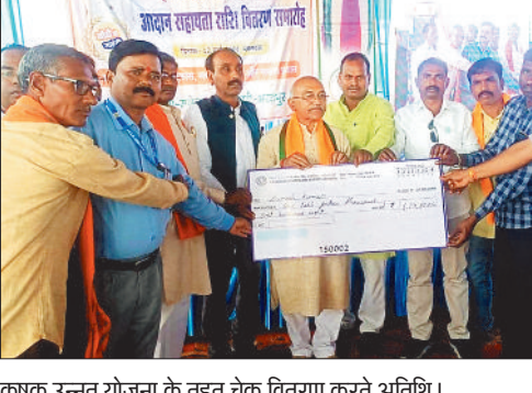
कृषक उन्नत योजना के तहत चेक वितरण करते अतिथि।